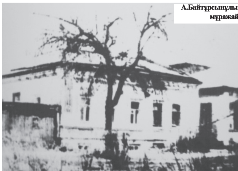
А.Байтұрсынұлының мұражай үйі.

Міржақып Дулатұлы секілді айнымас серіктерімен бірге қазақ халқының еркіндігі жолында тайсалмайтын ұлы күреске түсті.