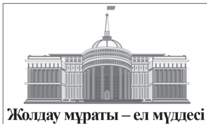
Жолдау мұраты – ел мүддесі

отбасылық зорлық-зомбылық жасаған адамдарға жаза күшейтіледі.