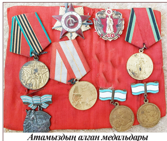
Атамыздың алған медальдары

Елге келгеннен кейін қарапайым жұмысшыдан ферма меңгерушісі болып жұмыс жасайды. Жасынан бастап өрмешілікпен айналысқан.