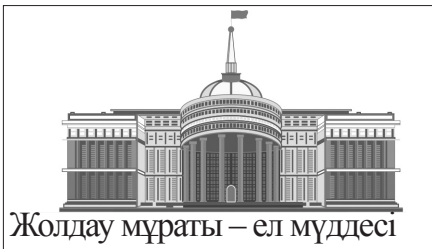
Жолдау мұраты – ел мүддесі

Президенттің жаңа Жолдауы шынайы саяси жаңғыру мен кешенді реформаларға бастау болды. Онда қоғамды толғандырып жүрген өзекті мәселелердің нақты шешімі айтылып, көкейкесті сұрақтарға жүйелі