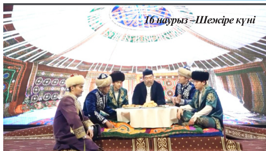
16 наурыз – Шежіре күні