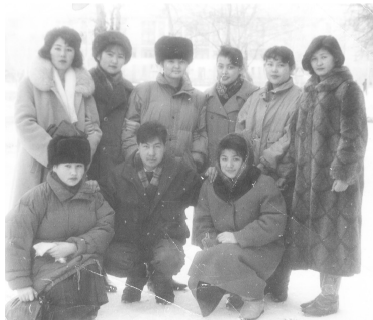
ҚарМУ-дың журналистика бөлімшесінің алғашқы студенттері 1993 жыл, қараша.

Сыздықұлы бізді әкеміздей қарапайымдылықпен қарсы алды. —Бірден айтайын сендер болашақ журналистерсіңдер. Ең алғашқы кезекте өткір болындар. Жалтақтық сендерге жараспайды, ойлана жазатын,