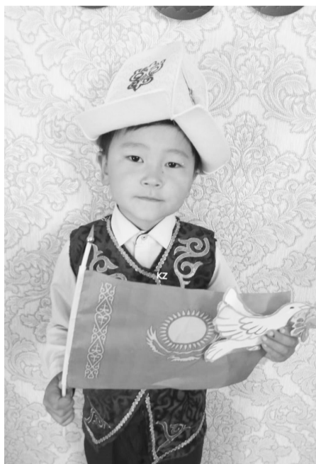
Айтбек Жасоркен Мерзатұлы Жақып Ақбай атындағы негізгі орта мектебінің 2-сынып оқушысы Қарамеде би ауылдық округі.