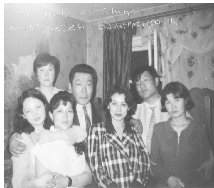
ҚарМУ-дың журналистика бөлімшесінің алғашқы түлектері, 1997 жыл.